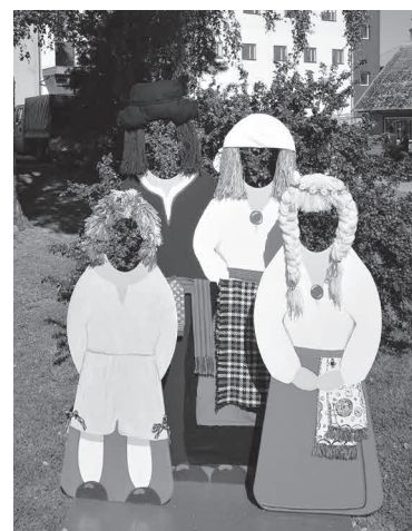
Puust mulgi pere, kellele egä peris pere võib oma näo anda, tulep ää meelege ja tiip siu pidu kah lõbusambes.