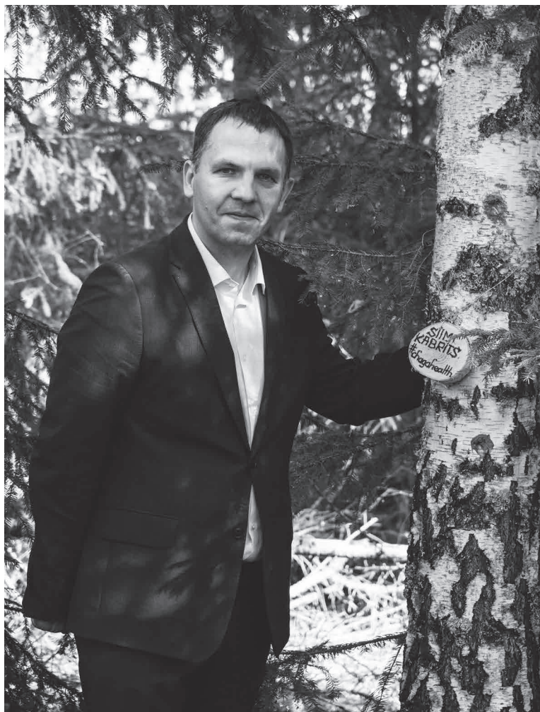
Kasepuid ei pia maha võtma ja palgis müümä. Kähkumb saap kõivast kasu sis, ku selle pääl kasekäsna kasvate.