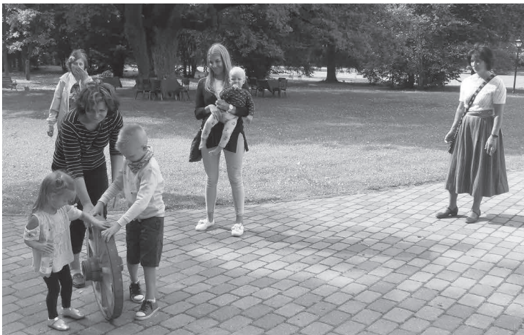
Kärstnen panti nii suure ku tillikse vankreratast veeriteme.

vaimuperändusest ja mulke endetäädmise tagastõukamine.