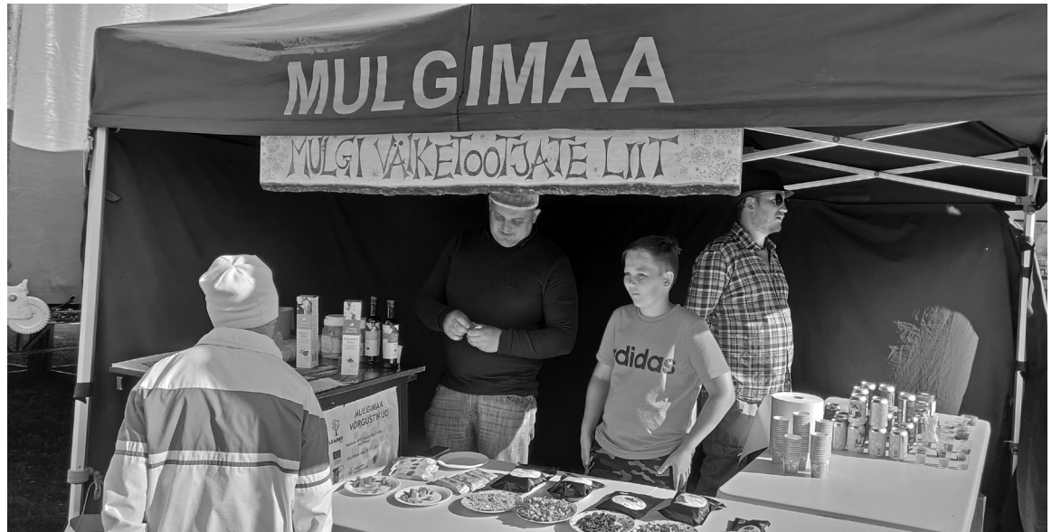
Mulgimaa väiksit ettevõttit näep järest tihembine üte katusse all sama leti veeren oma kaupa pakman.

Õlle mekmise võistluse teive läbi üttese inimest. Alades ollive kigepäält kannust 50 rammi juumine täpsuse pääle ning õllelaasi oidmine sirge käte pääl suure Karksi-Nuia I Ordumeistre nua otsan ja ahvatleve õllekannu vaatmine. Siin elli rahvas ligi, nalla sai pallu ja Mulgi Pruulikoja õlu olli nautlemises väegä mõnus. Samal aal loositi kodukohvikut külästanu inimeste vahel vällä suur Mulgi Väiketootjate Liidu kinkekott. Auindu jagus nii suurtel ku väiksetel ja sedä puha oma Mulgi tuutjate puult. Ettevõtmine läits kõrda ja maha sai ütelt ka uvve vestivaali pidämise aig – sii tulep 30. mail 2020 ütten kuvvende Mulgi piduge üitsöist toeteden ja sis om päätegelases mulgikapust. Kõrraldajase tänave kikki, kes osa võtve, kuuntuupartnerisi, Eesti Rahvakultuurikeskust, Mulgi valda, Tõrva valda, Karksi-Nuia Kultuurikeskust ja Mulgi Kultuuri Instituuti. Mulgi Väiketootjate Liidu kaup om pirla üte rindena müügil Imavere tikupoen, läbirääkmise käivä Mulgi