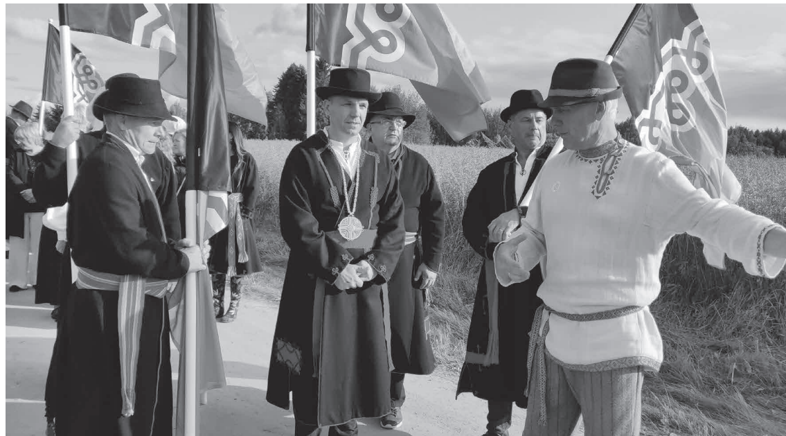
Setumaa Kuningriigi päeval võeti mulke lahkest vastu.