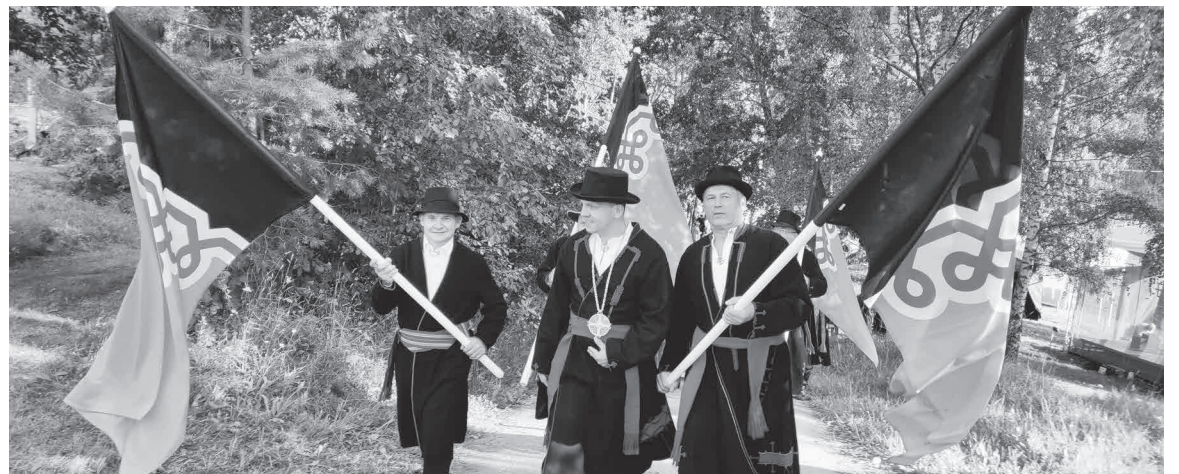
Mulgi mihe Mulgimaa lippege Setumaal.

Mulgi Kultuuri Instituut kutsup Mulgimaa aridusasutusi tähisteme Mulgi lipu päevä, et üttenkuun oida au sihen ja näidäte uhkusege kigile oma kanti ek Mulgimaaad.