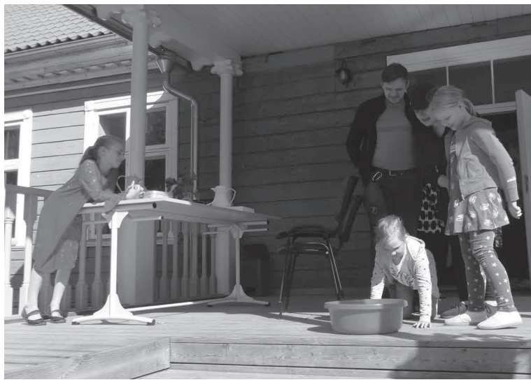
Riidajate laste ollive mõisamaja man mängulistel ette valmisten ulka põnevit ülesandit. Edimelt tullu suumõsukausist vii siist pudel ilma käte abite kätte saia.

Laiembelt võip peremängu mõjo jagade kolme kandi pääle – Mulgimaa MTÜde ja ettevõtjide toetamine, tääduse andmine Mulgimaast, mede